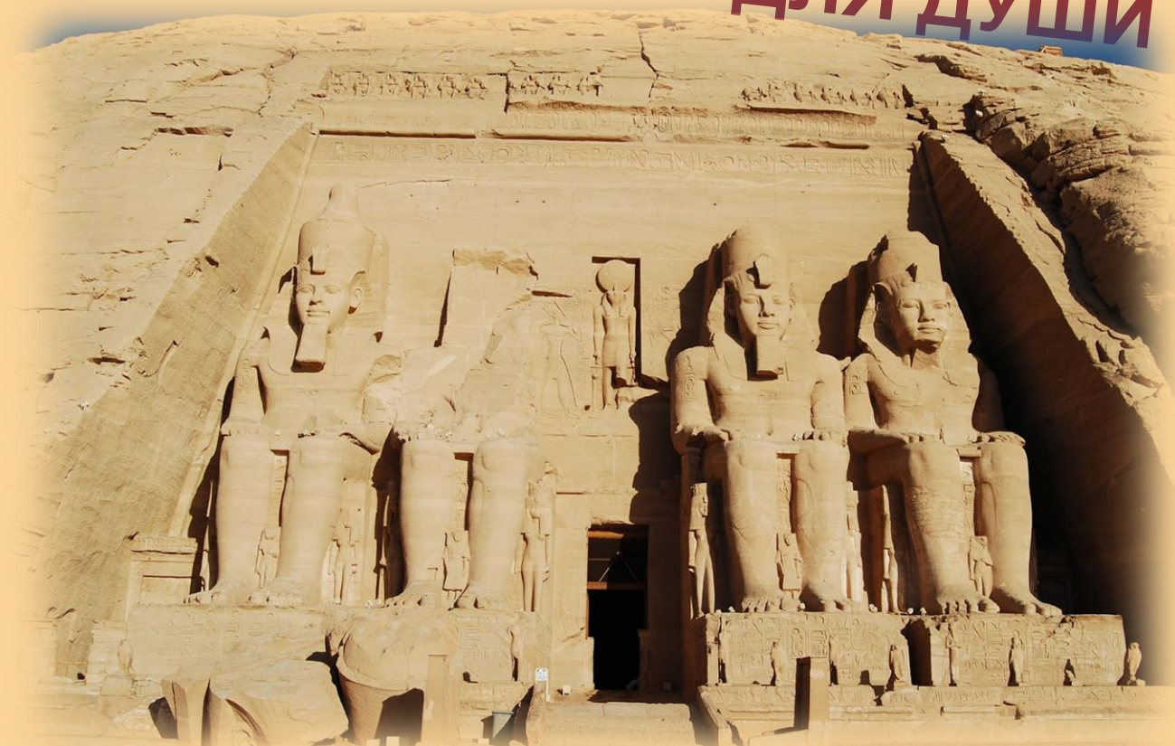
Библиотека фараона Рамзеса II (1300 год до н.э.) 14